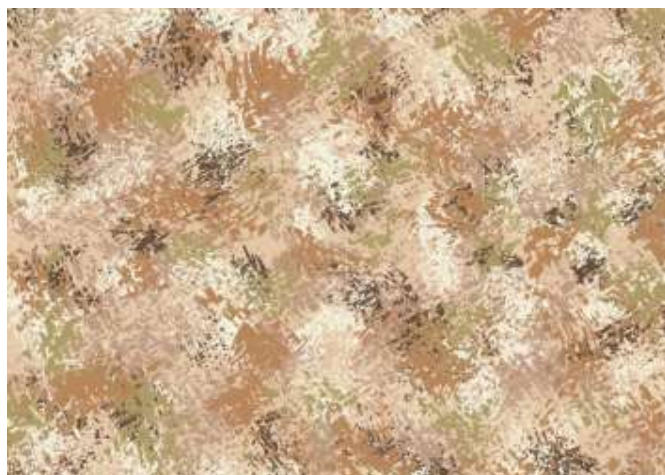
заявленный внешний вид изделия