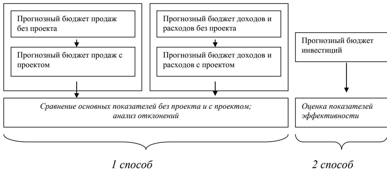
Рис. Методики оценки инвестиционных проектов в инновационной сфере

По мнению авторов, в контексте систем финансового планирования предприятий представленные методы оценки будут выглядеть следующим образом (см. рисунок).